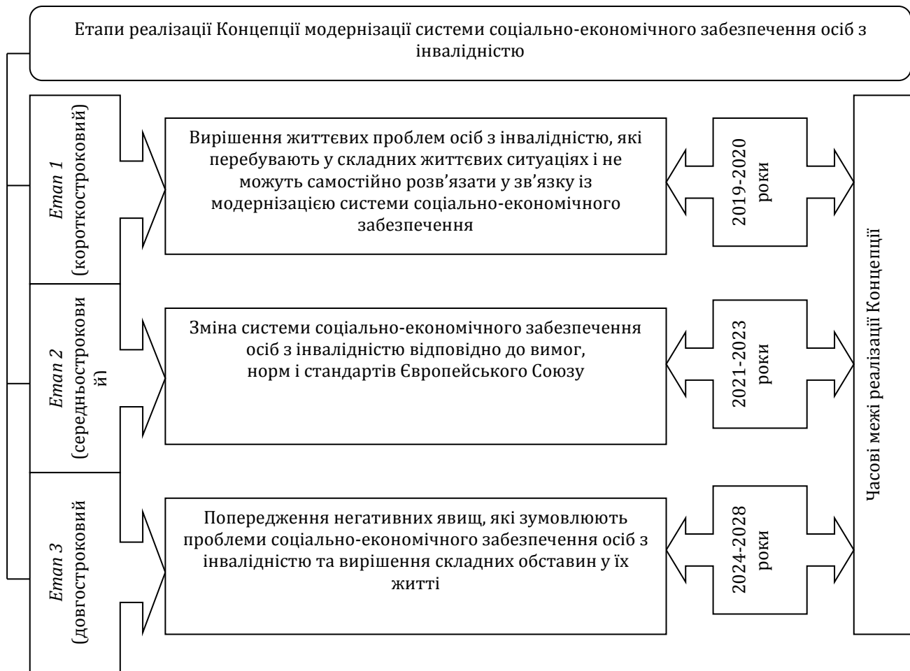
Рис. 1. Етапи реалізації Концепції модернізації системи соціально-економічного забезпечення осіб з інвалідністю в Україні*

Модернізація системи соціально-економічного забезпечення осіб з інвалідністю повинна проводитися системно, цілеспрямовано та базуватися на таких основних принципах та критеріях ефективності її функціонування: