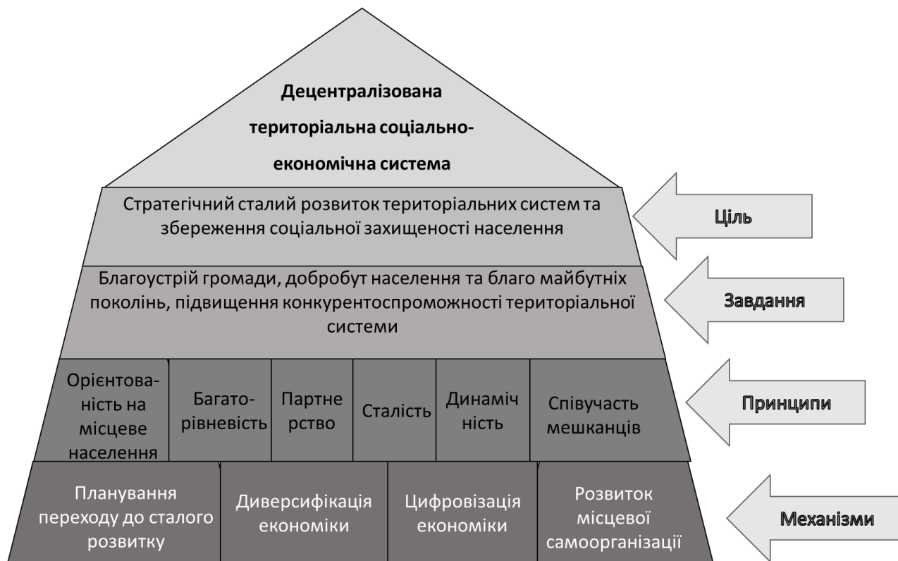
Рис. 2. Методологічна піраміда формування та розвитку децентралізованої соціально-економічної територіальної системи