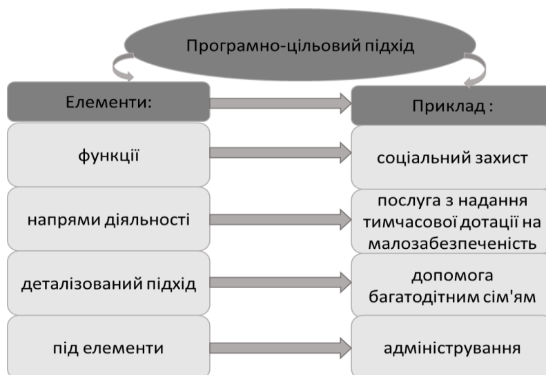
Рис. 2. Ієрархічна структура програмно-цільового підходу

Таким чином, застосування програмно-цільових підходів на рівні управління територіальними системами використовуються єдині методичні підходи, що передбачають обґрунтування елементів ієрархічної структури (функції, напрями діяльності, деталізований підхід, складові елементи), формулювання мети, завдань та визначення індикаторів результативності (рис. 2). Мета (ціль) діяльності передбачає лаконічне обґрунтування функцій, які мають бути узгоджені із національними та регіональними стратегіями розвитку, враховувати специфіку територіальної системи. Основою для розробки територіальних програм розвитку має бути обґрунтування очікуваних результатів, спрямованих на соціально-значущі результати та покращення життєдіяльності територіальної громади.