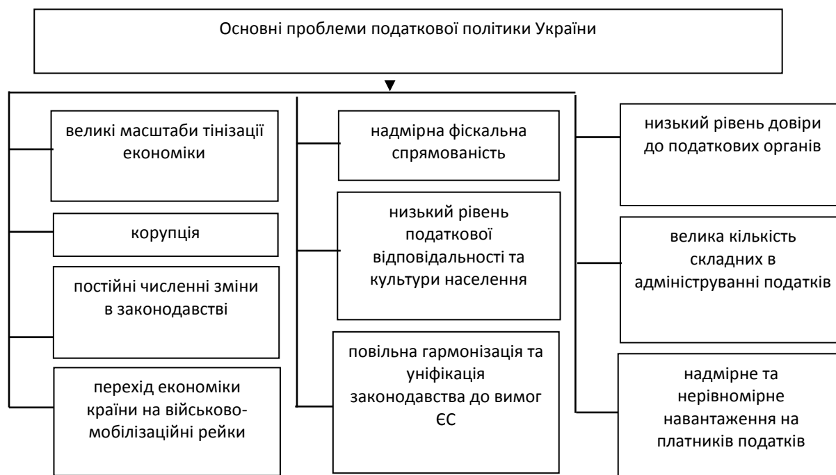
Рис. 2. Основні проблеми податкової політики України

Основні проблеми української податкової політики згруповані на рис. 2.