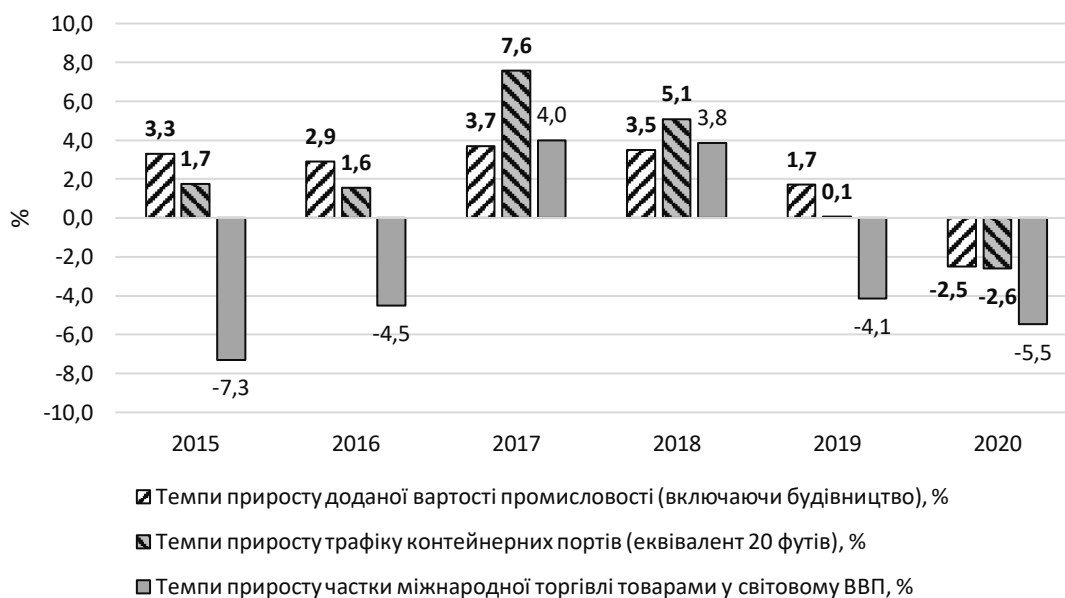
Рис. 2. Динаміка деяких показників міжнародної економіки у 2015-2020 роках

контейнерних портів, які обслуговують близько 80% світової торгівлі. Порушення логістичних ланцюгів призвело до зниження вартості промислової продукції та зменшення частки міжнародної торгівлі у світовому ВВП (рис. 2).