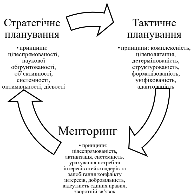
Рис. 2. Концептуальна модель врахування принципів і закономірностей побудови стратегії та тактики розвитку інноваційної діяльності підприємств на засадах активізації менторства

цілеспрямованості, системності, наукової економічної ефективності, оптимальності, обґрунтованості, об'єктивності, дієвості, постійного удосконалення (рис. 3).