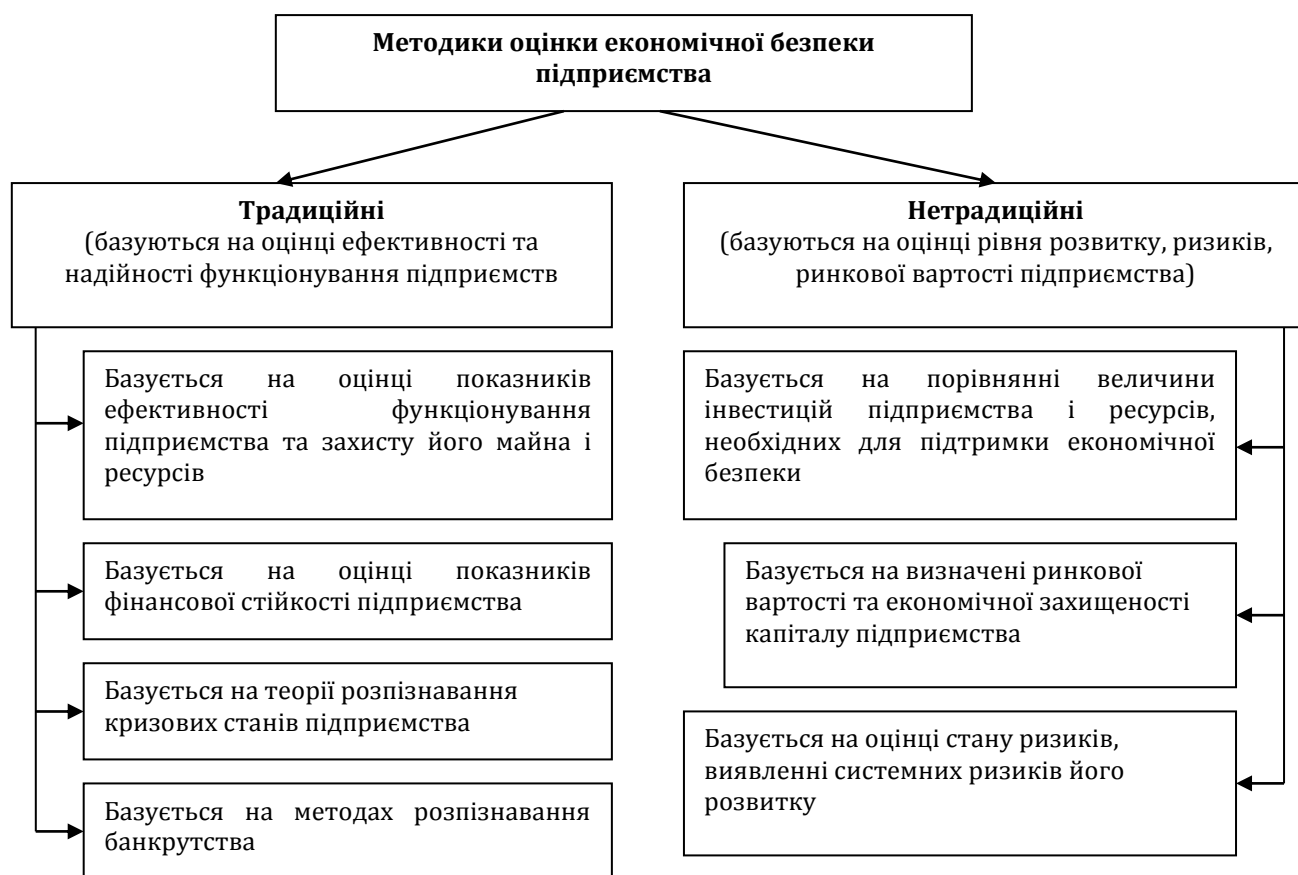
Рис. 2. Методичні підходи до оцінки рівня економічної безпеки підприємства [4, с. 32]

розробка та впровадження експрес-діагностики, яка дозволить за її результатами з мінімальними витратами часу та максимальною ефективністю приймати управлінські рішення [4, с. 31].