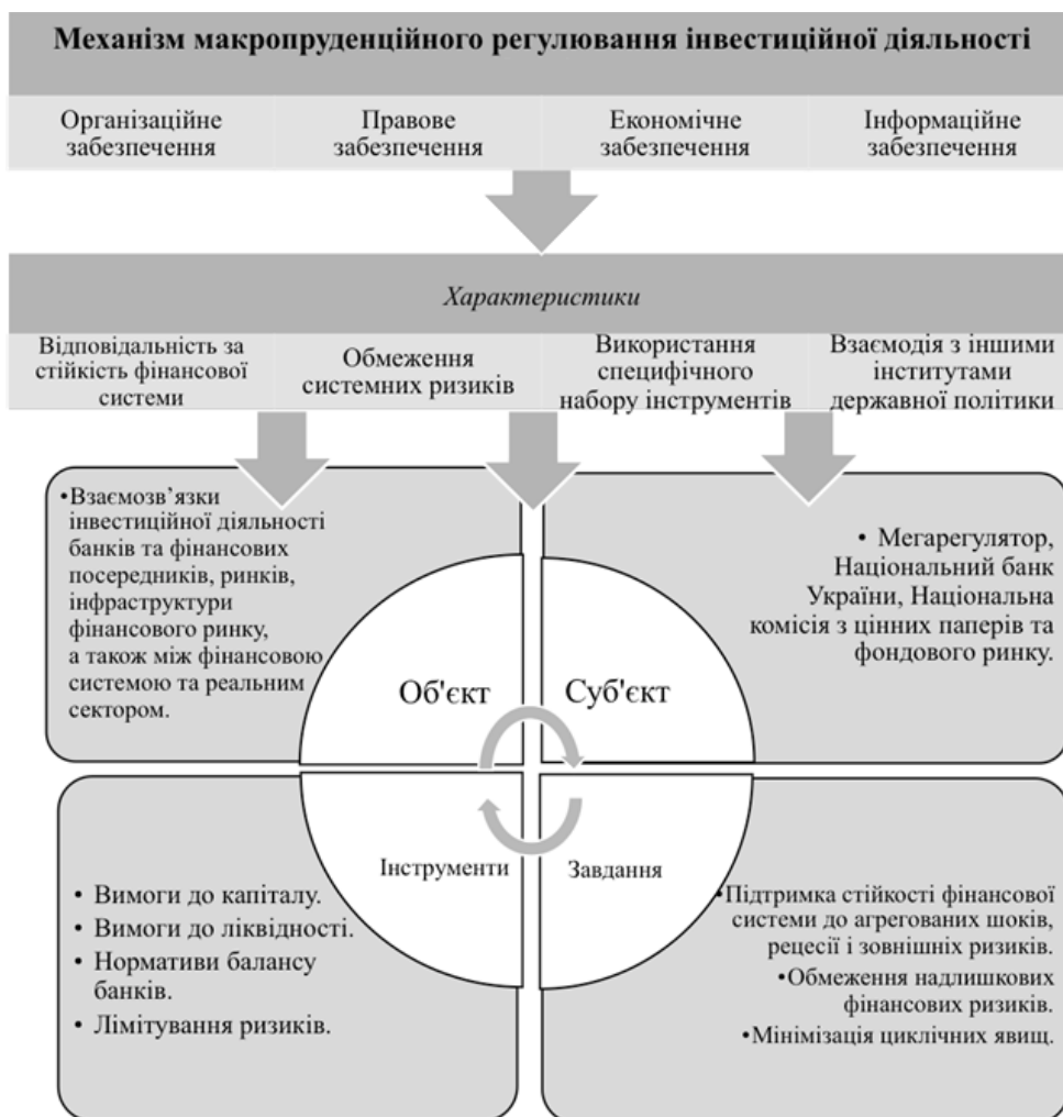
Рис. 3. Механізм макропруденційного регулювання інвестиційної діяльності фінансового сектору*

Механізм макропруденційного регулювання інвестиційної діяльності фінансового сектору наведено на рис. 3.